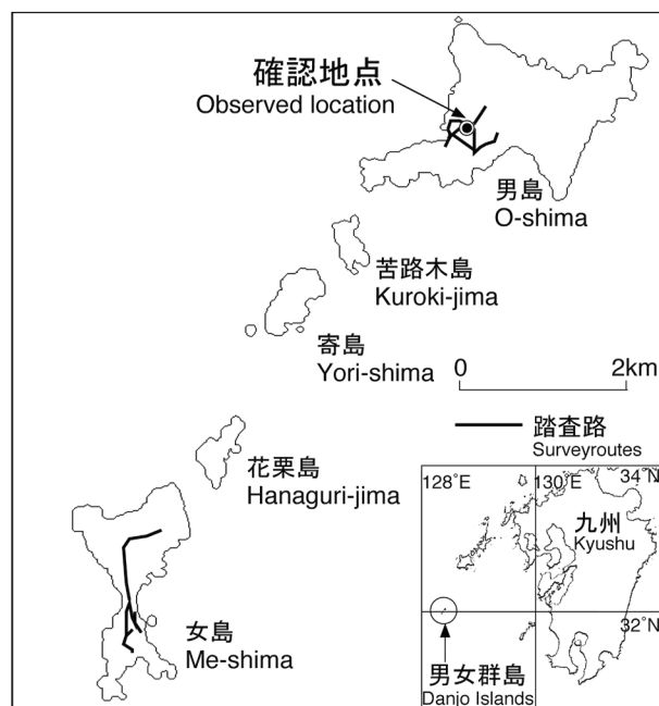
Fig. 1. 調査地の位置

男女群島は五島列島の南南西約70kmの東シナ海に位置する島嶼群である(Fig.1)。孤立した無人島群であるために、これまでの生物調査の記録は限られている。男女群島のサワガニ類については道津(1973)が、男島に少数のサワガニ類が生息し、採集されたオオウナギ