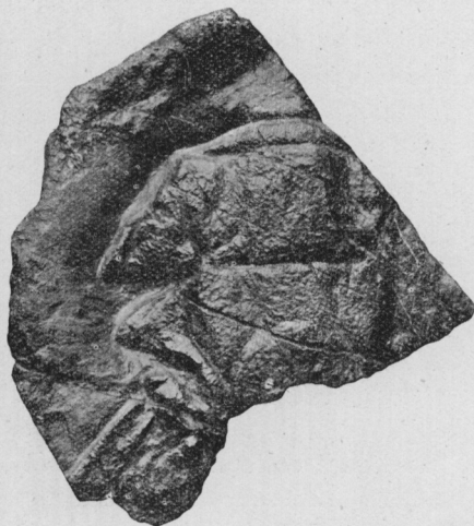
Fig. 1. — Platyleon nevadensis VAN STRAELEN, 1936. Type. — Triasique supérieur. — Nevada. Grandeur naturelle.

Exopodite de l'uropode très large, traversé longitudinalement par deux carènes et pourvu d'une diérèse.