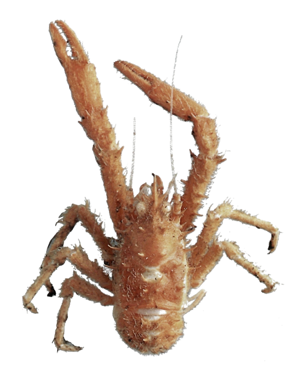
イバラシンカイコシオリエビ Munidopsis erinacea (A. Milne Edwards, 1880)

特 徴: 甲長1 cm。甲幅は狭く,左右に湾曲する。甲面は長い毛と左右相称に配列された長いとげでおおわれている。原胃域に1対,後胃域に1対,心域に2対,鰓域に3対の合計14本のとげがあり,甲の側縁には前側角のとげを含めて5本のとげがある。額角は長く,中央部に斜め前方を向くとげがある。第1,2触角の基節,第3顎脚にも数本の長いとげがある。眼の角膜部は大きいが,色素はもたない。第2腹節には4本,第3,4腹節にはそれぞれ6本のとげがある。はさみ脚にも長毛があり,長節と腕節には長いとげが多数ある。歩脚にも長毛ととげがある。