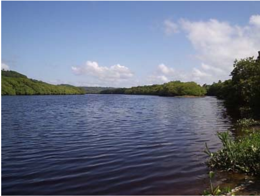
Figura 3. Manguezal do estuário do rio Almada, Ilhéus, Brasil. Figure 3. The mangrove of the Almada River, Ilhéus, Brazil.