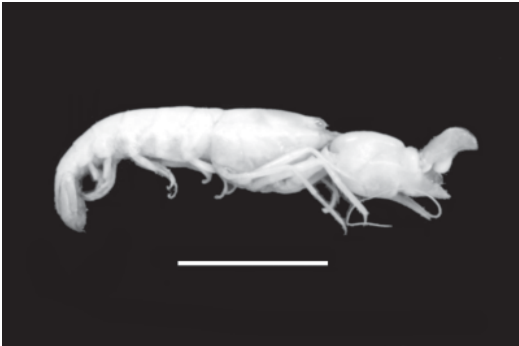
Figura 6. Alpheus heterochaelis Say do estuário do rio Cachoeira, Ilhéus, Brasil. Barra = 10 mm.

Figure 6. Alpheus heterochaelis Say from the Cachoeira River estuary, Ilhéus, Brazil. Scale bar = 10 mm.