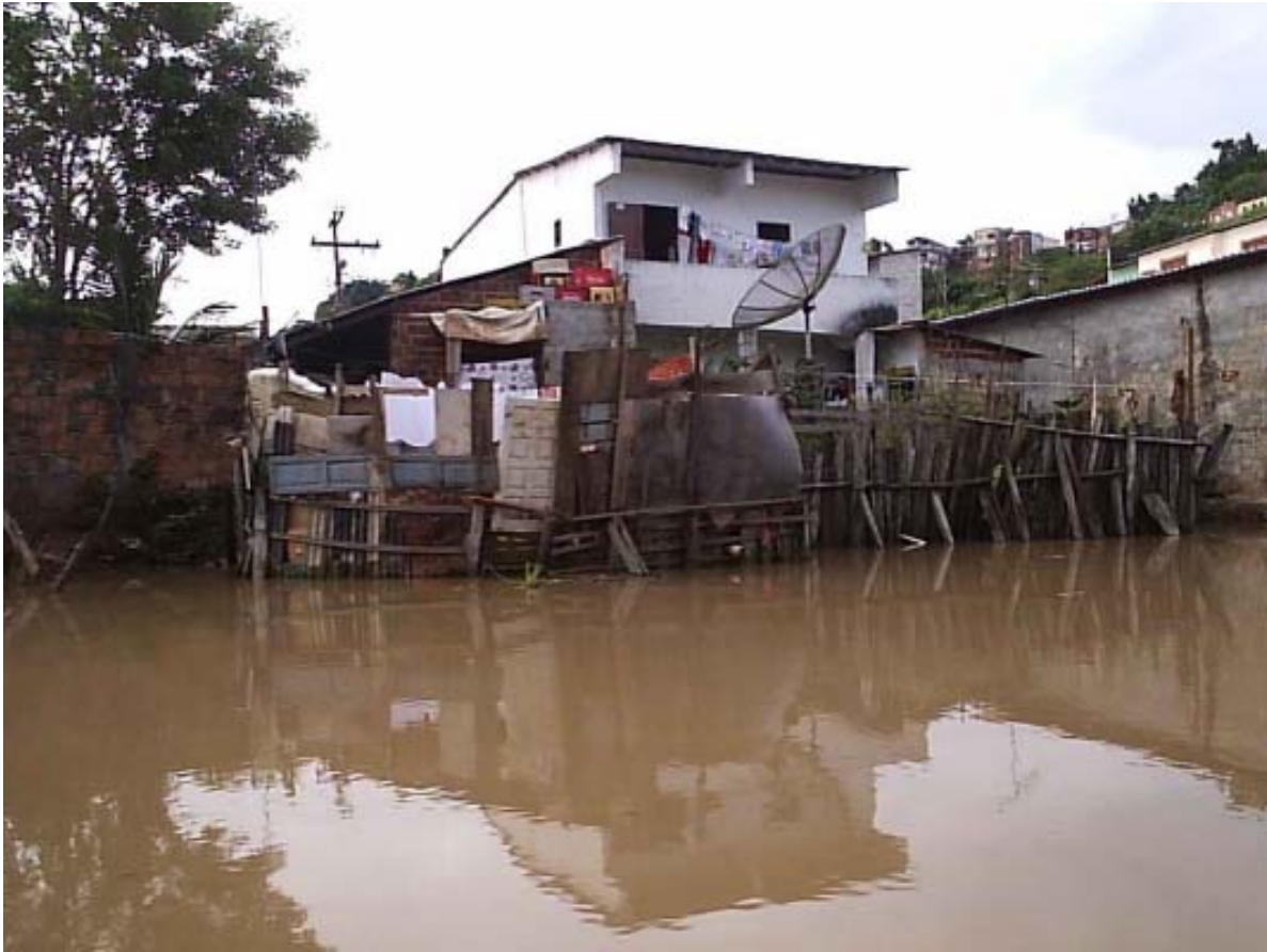
Figura 5. Impacto da urbanização descontrolada em um canal estuarino próximo ao centro da cidade de Ilhéus, Brasil. Figure 5. Uncontrolled urbanization in an estuarine channel near Ilhéus central area, Brazil.

Cachoeira foram realizadas coletas inclusive na área urbana, como as avenidas Sapetinga, 2 de Julho, Lomanto Júnior, praia do Cristo e praia da Maramata (ver coordenadas geográficas no anexo). As coletas efetuadas durante a baixamar foram realizadas manualmente e com o auxílio de armadilhas artesanais como a siripóia (equipamento artesanal para pesca de siris). Procurou-se abranger todos os microhabitats do ambiente estuarino, tais como tocas escavadas na areia e lama, folhas e troncos em processo de decomposição, raízes e troncos das árvores do mangue, sob e sobre pedras, em bancos de algas, mexilhões e ostras.