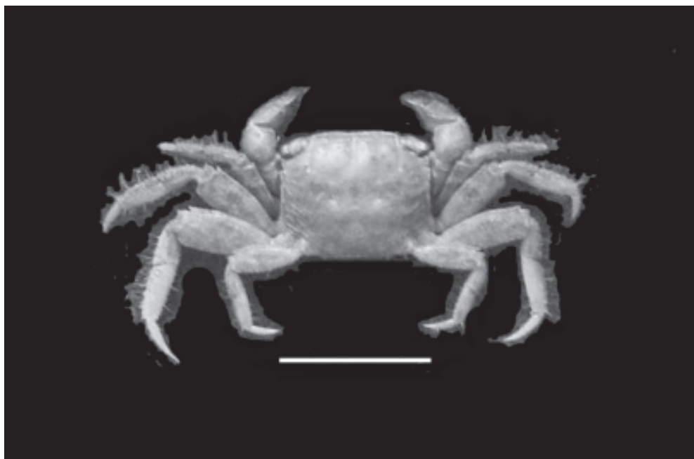
Figura 9. Sesarma curacaoense De Man do estuário do rio Almada, Ilhéus, Brasil. Barra = 10 mm.

Notas ecológicas: Escava tocas que ficam a descoberto vários dias, de acordo com altura da preamar. Pode ser encontrado em todos os regimes de salinidade (Melo 1996).