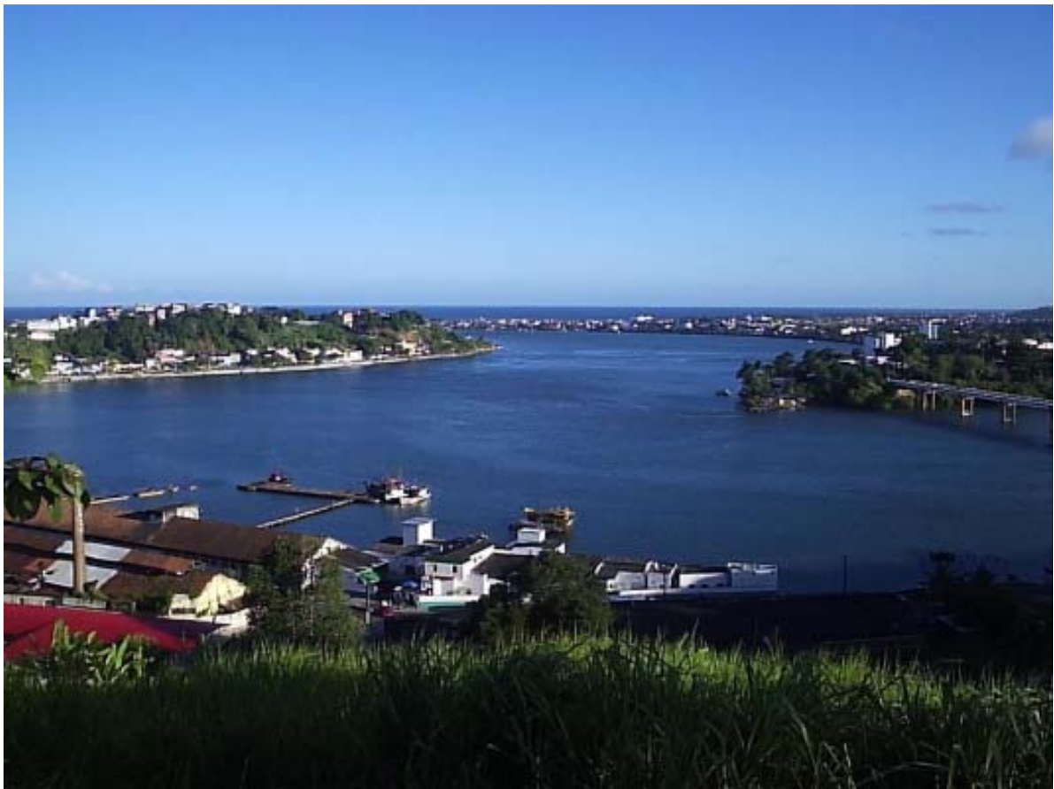
Figura 2. Estuário do rio Cachoeira, Ilhéus, Brasil: o maior estuário da região.

Figure 1. Localization of the study area: Ilhéus, State of Bahia, Brazil. (A) Almada River; (B) Fundão River; (C) Cachoeira River; (D) Santana River; (E) Ilhéus central area, (F) Ilhéus harbor. Source: Miranda & Coutinho (2004).