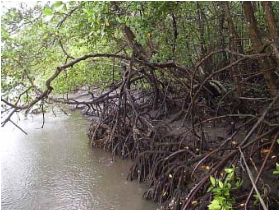
Figura 4. Manguezal com Rhizophora mangle (Rhizophoraceae) no estuário do rio Santana, Ilhéus, Brasil. Figure 4. Rhizophora mangle (Rhizophoraceae) from the Santana River estuary, Ilhéus, Brazil.