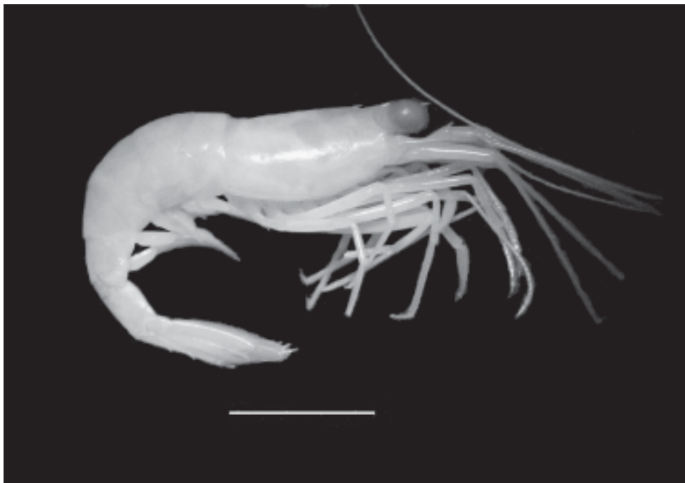
Figura 7. Merguia rhizophorae Rathbun do estuário do rio Mamoã, Ilhéus, Brasil. Barra = 5 mm.

Figure 6. Alpheus heterochaelis Say from the Cachoeira River estuary, Ilhéus, Brazil. Scale bar = 10 mm.