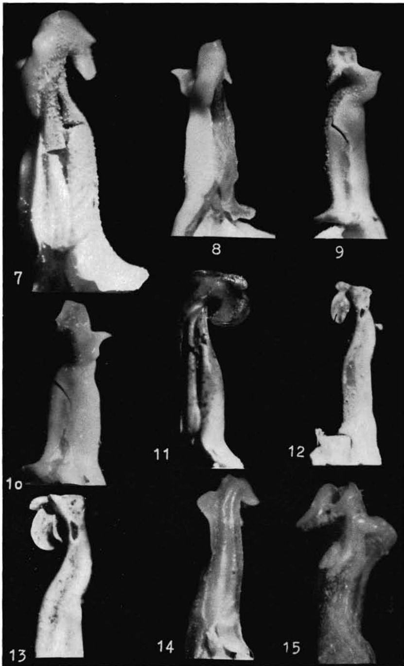
7-10: Pseudothelphusa (Pseudothelphusa) americana americana SAUSSURE, "Cuba", Go/I. 7. ventral, 8 von innen, 9. dorsal, 10. dorsal aussen.? Lectotypus? 11-13: Pseudothelphusa (Pseudothelphusa) americana lamellifrons RATHBUN, Mexiko, Go/I. 11. ventral, 12. dorsal, 13. Endteil von dorsal. 14-15: Elsalvadoria zurstrasseni zurstrasseni (BOTT), El Salvador, Go/I, Paratypoid. 14. ventral, 15. dorsal.